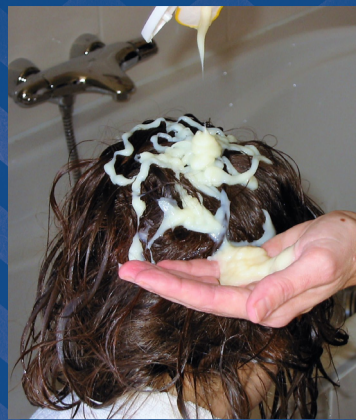
Doe veel conditioner (crèmespoeling/balsem) op het haar