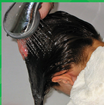
Spoel de conditioner uit het haar.