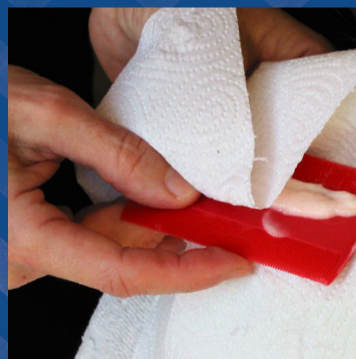
Veeg na elke kambeweging de luizenkam af aan het witte keukenpapier en kijk of je luizen kan zien. Met een tandenstoker kun je de luizen uit de kam verwijderen.