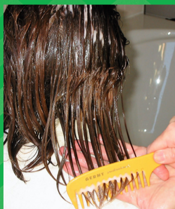
Kam het natte haar los met een gewone kam