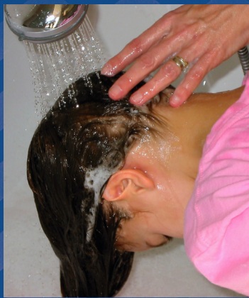
Spoel het haar goed uit (niet drogen)