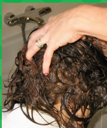
Wrijf de conditioner goed in (spoel nog niet uit)