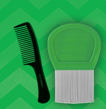
Spoel de kammen met heet water.