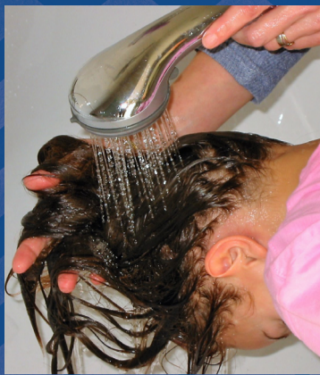
Maak het haar nat