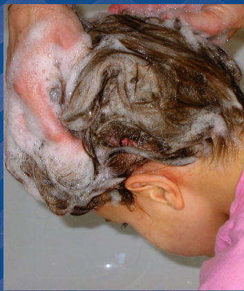
Was het haar met een gewone shampoo