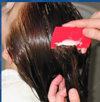
Kam een tweede keer in de andere richting met de luizenkam: van voorhoofd tot nek. Begin ook deze keer bij het ene oor en eindig bij het ander. Duw de luizenkam dicht tegen de hoofdhuid aan!