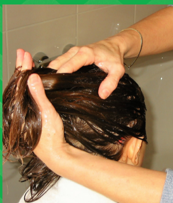
Verdeel de conditioner over het haar