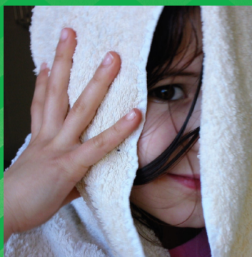
Droog het haar met een handdoek.