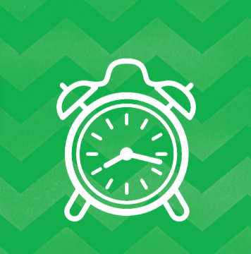
De hele kambeurt duurt zeker 15 tot 20 minuten!

HERHAAL MINSTENS OM DE 2 À 3 DAGEN GEDURENDE 2 WEKEN. ALS JE DE EERSTE DAG ALLE LUIZEN HEBT VERWIJDERD, KUNNEN ER TOT TWEE WEKEN DAARNA NOG NIEUWE LUIZEN UIT DE NEETJES KOMEN DIE JE NIET HEBT VERWIJDERD.